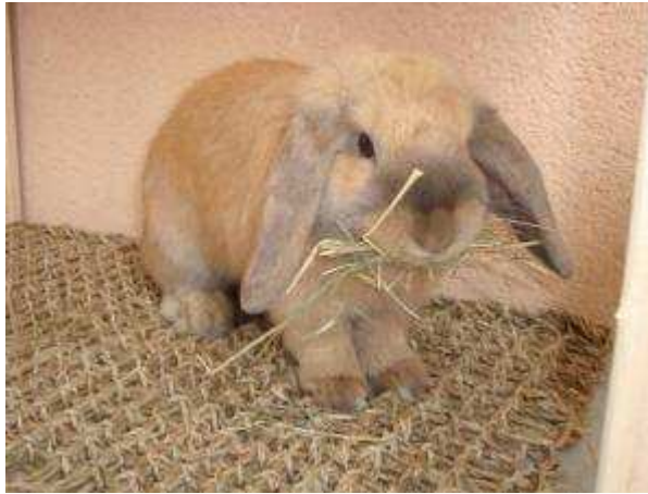
Lilo accumule du foin dans la bouche pour construire un nid

Flore et Quinoa avant leur stérilisation, qu'il vaut peut-être mieux le laisser en place, car la lapine risque de le reconstruire immédiatement, s'épuisant ainsi davantage.